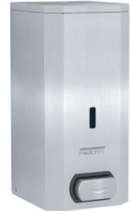
174980 INOX SATINADO